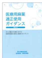
改訂医療用麻薬適正使用ガイダンス