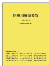
医療用麻薬要覧R6年版

5. 参加費：無料 ※会場参加者には講習会テキスト（レジメ集）の他に、以下の資料を配布します。