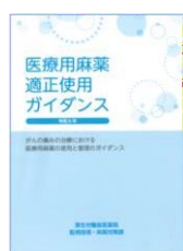
改訂医療用麻薬適正使用ガイダンス