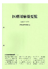
医療用麻薬要覧 (2025年8月)

5. 参加費：無料 ※会場に参加される方には講習会テキスト(レジメ集)の他に以下の資料を配布します