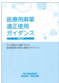
改訂医療用麻薬適正使用ガイダンス