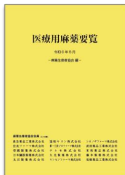
医療用麻薬要覧R6年版

5. 参加費：無料 ※会場参加者には講習会テキスト（レジメ集）の他に、以下の資料を配布します。