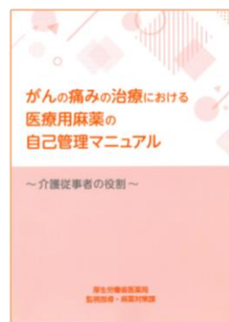
がんの痛みの治療における医療用麻薬の自己管理マニュアル